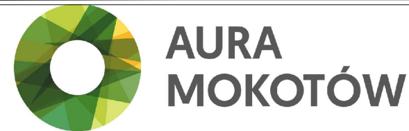
Położenie lokalu na terenie inwestycji: