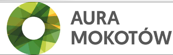
Położenie lokalu na terenie inwestycji: