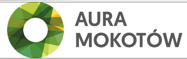
Położenie lokalu na terenie inwestycji: